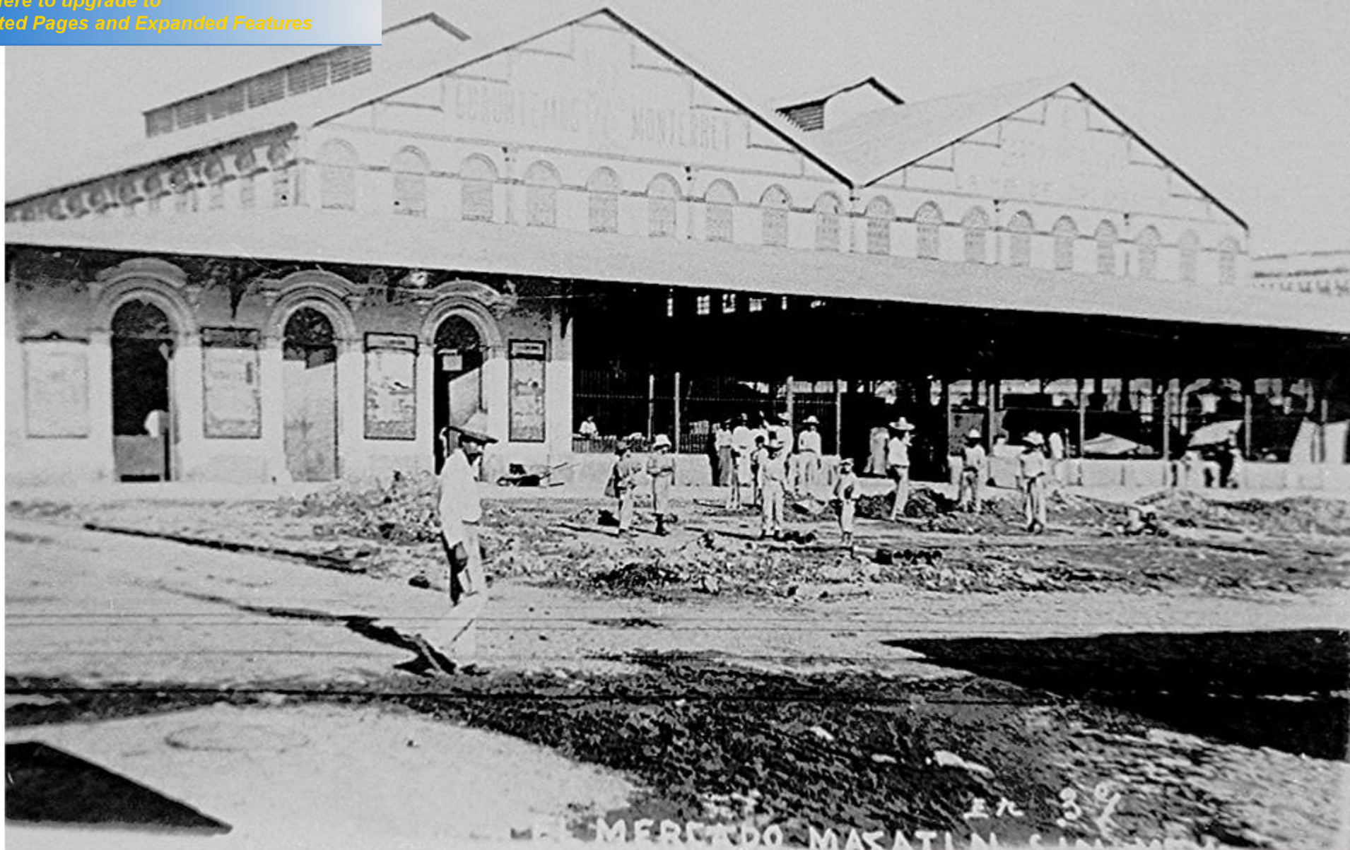
En 1951 se realizaron las obras para darle una nuevo aspecto al mercado.